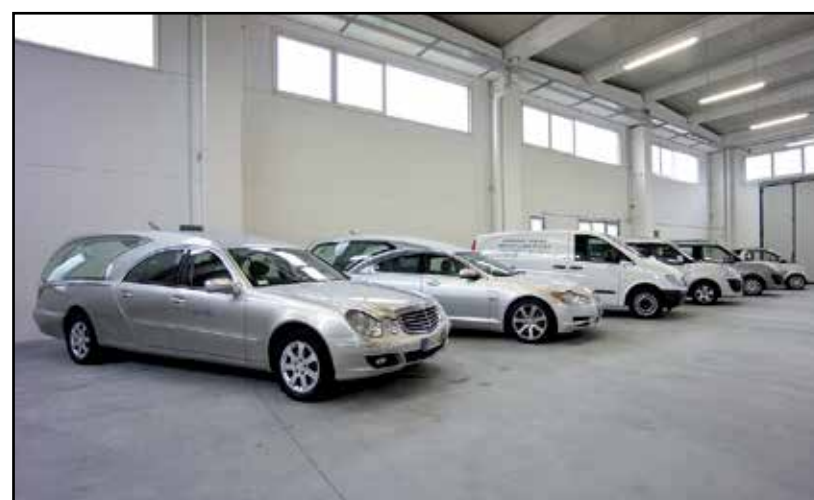
Il parco mezzi della ditta, servizio Italia ed estero.