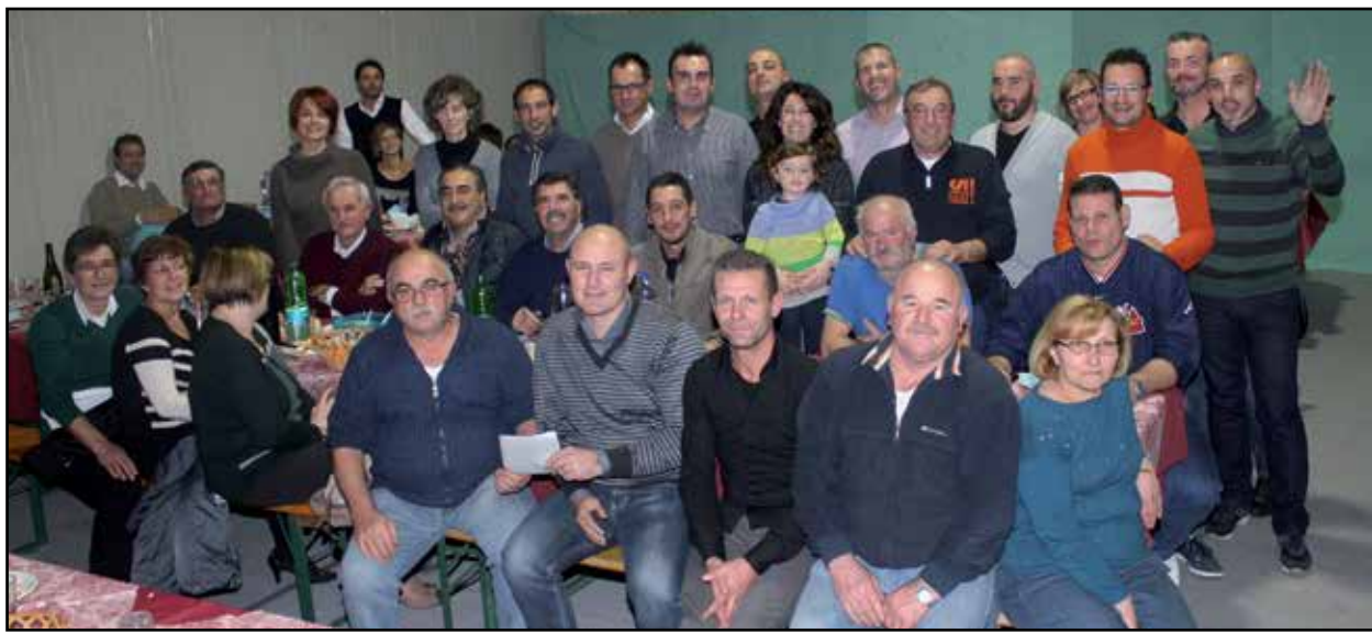
La consegna della busta al Presidente Zanetti.