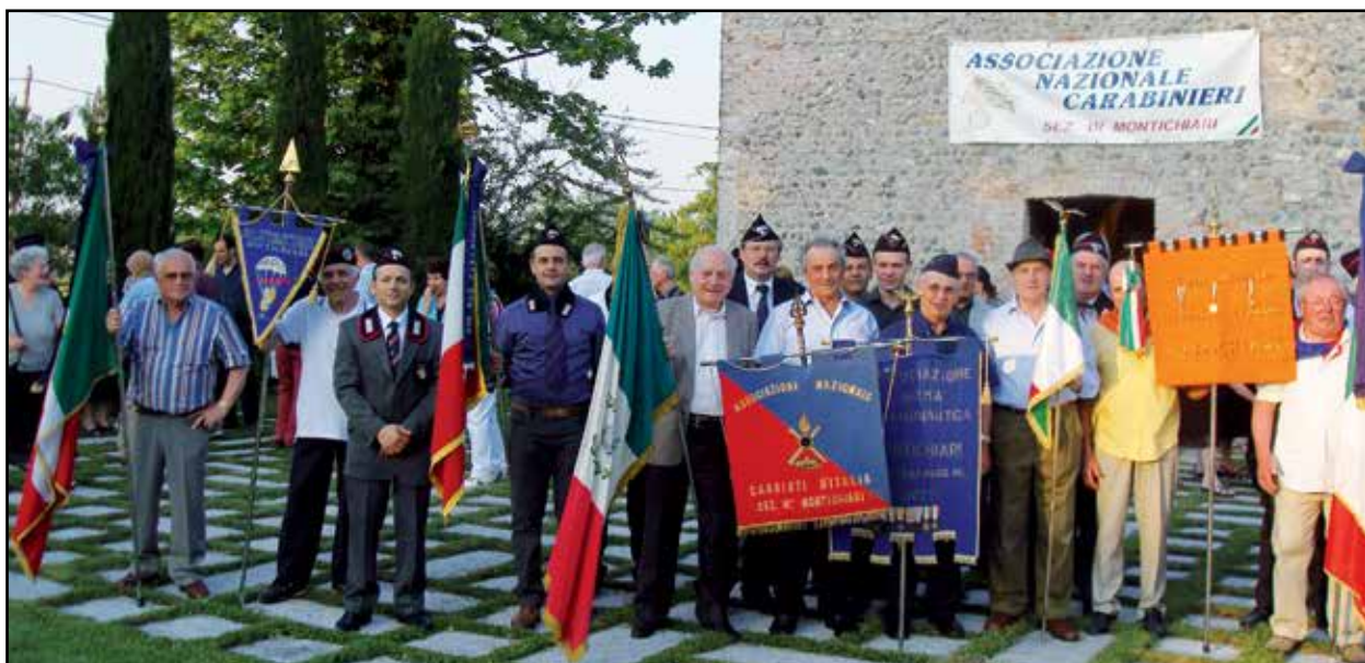
I labari presenti alla cerimonia dello scorso anno davanti alla chiesetta di S. Cristina.