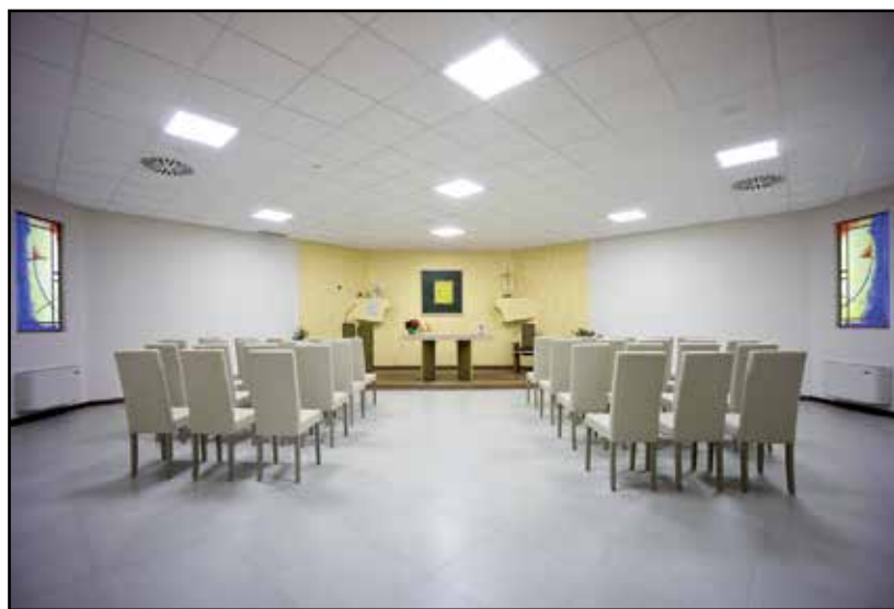
La Cappella adibita a cerimonie funebri.