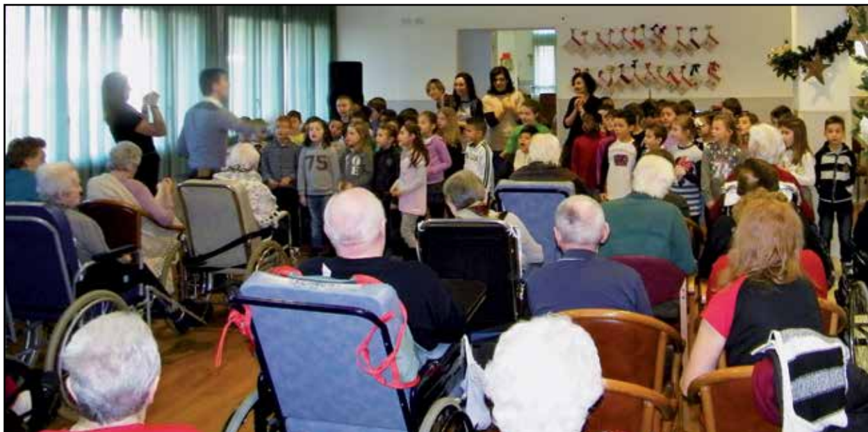
L'incontro della scolaresca con gli anziani della Casa Albergo.

Oggigiorno è più facile "incartare" il Natale in una confezione regalo, così come è facile pensarlo nella sola luce della tenerezza, della fantasia e dei buoni sentimenti. Ma il Natale non è solo ciò... il cuore deve battere altrove... e gli insegnanti delle classi seconde dei Chiarini hanno provato a farlo capire ai loro alunni, ovvero che Natale è qualcosa di più. Natale è sapersi donare e non solo ricevere. Natale è sapersi mettere in gioco e non solo giocare. Natale non è solo per i bambini, ma è per tutta la gente.