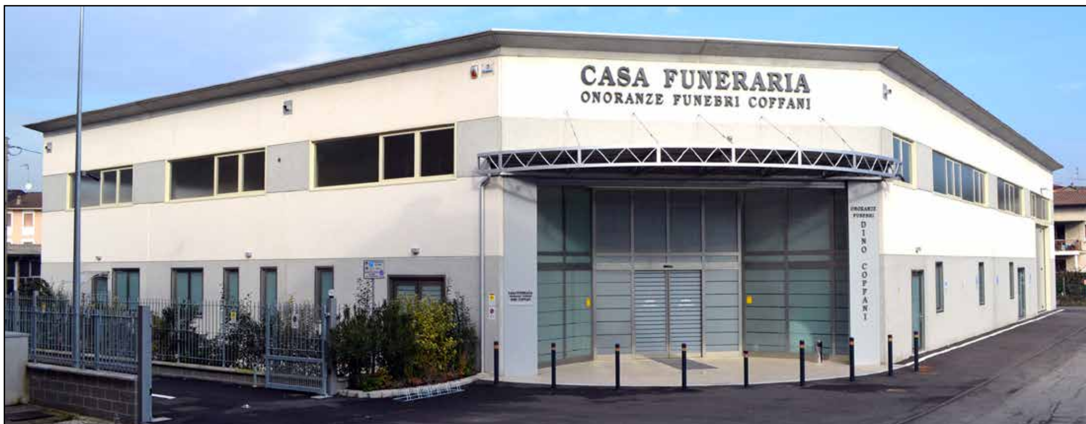
La nuova Casa Funeraria, servizio gratuito, in via Brescia 50 a Montichiari, il miglior servizio nei giorni del lutto.