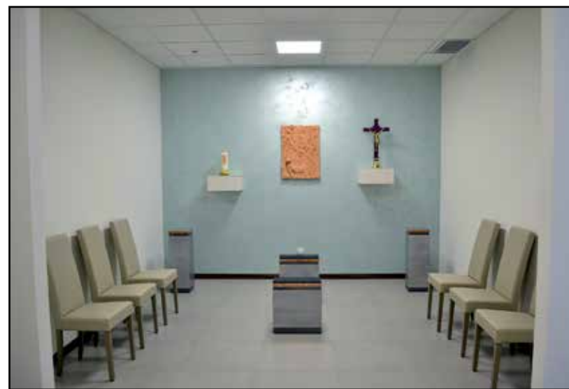
Una delle quattro sale di attesa per parenti ed amici.