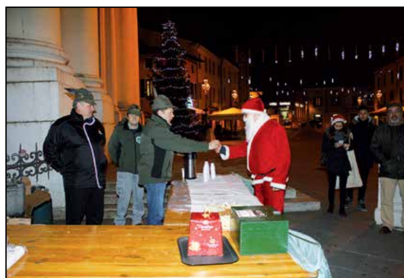
Gli Alpini in Piazza S. Maria.

Un assaggio di panettone e del buon vin brulè. Ne ha subito approfittato Babbo Natale, del vicino bar, per riscaldarsi e augurando agli alpini presenti una buona serata.