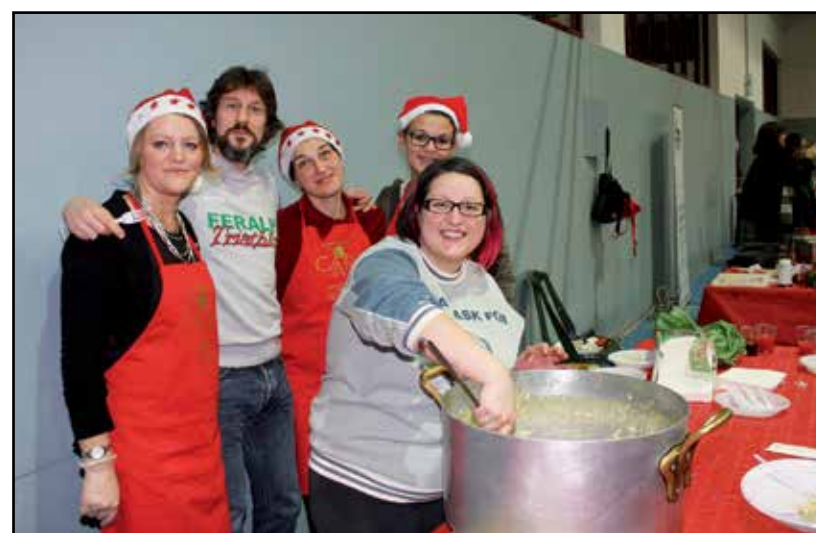
Come ti cucino un risotto mantecato.