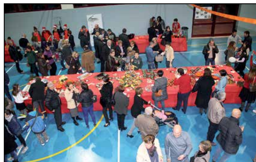
Una tavola imbandita di specialità, opera dei genitori.