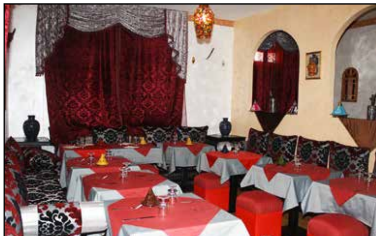
LA NUOVA SALA RISTORANTE

PIATTI PER VEGETARIANI E VEGANI DOLCI TIPICI SIRIANI E VEGANI